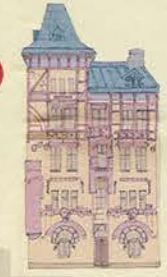
La Maison du Tisserand Ткацький Дім Tkalčův dóm 9