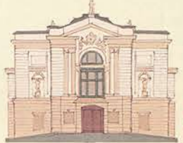
Le Théâtre Polonais Польський Театр Polské divadlo 1