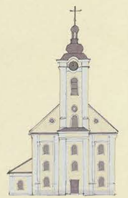
L'église évangéliste d'Augsbourg Martin Luther Євангелїцька Церква Мартїна Лютєра Аугсбурзького вїросповідання Evangelicko-augsburský kostel Martina Luthera 8