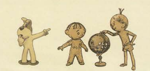
12 13 Les sculptures de Rexko et de Bolek et Lolek Скульптури Рєксї та Болека і Льольєка Sochy Rexika a Boleka a Lolka.